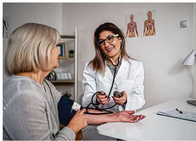
Vertrauen ist beim Arztbesuch eines der wichtigsten Dinge

Patientinnen braucht, ist Orientierungshilfe, um die richtigen Ärzte für deren individuellen Bedürfnisse zu finden. Das Institut für Management und Wirtschaftsforschung misst seit nunmehr vier Jahren die Beliebtheit der österreichischen Ärzteschaft anhand der Online-Kommunikation der Patientinnen und Patientinnen. Der KURIER ist Partner dieses Gütesiegels.